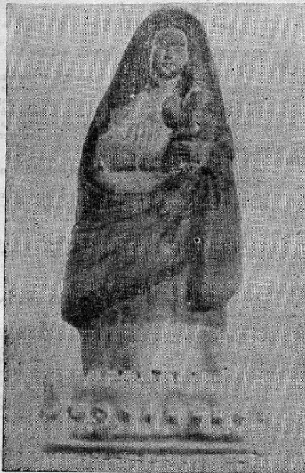
MUNDO FEMENINO se postra de rodillas ante la Patrona de COSTA RICA, cuyo aniversario celebrase hoy. Y le pide humildemente interceder por el bien de la Patria, para que brillen siempre en su cielo el trabajo y la paz.