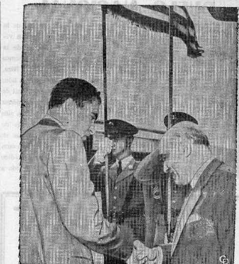
EL PROFESOR AMINTORE FANFANI, Premier y Ministro del Exterior de Italia, es saludado por el Vice-presidente Richard M. Nixon a su llegada a Washington. El líder italiano expresó su confianza de que el Medio Oriente puede ser salvado "para la causa de la libertad".

Es un hecho que para la V Feria se tenga perfectamente organizado un cuadrangular de fútbol, en el que tomarían parte equipos de renombrado prestigio internacional, incluyendo naturalmente un equipo basillero que cuente en sus filas con el mayor número posible de jugadores que ostentan hoy el título de campeones mundiales.