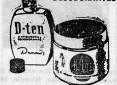
REGULA LA TRANSPIRACION DE LAS AXILAS Y LAS DESODORIZA POR VARIOS DIAS.