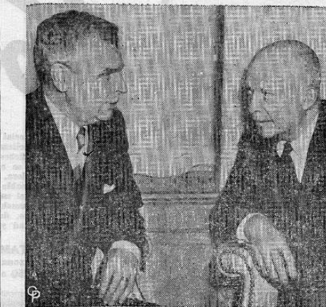
EL PRESIDENTE EISENHOWER y el Primer Ministro de Canadá John Diefenbaker posan en la residencia de este último en Ottawa, después de la primera de sus discusiones privadas. Abrieron su reunión de "pequeña Cumbre" con conversaciones preliminares sobre el comercio con la China Roja, problemas de desarme, defensa continental y la amenaza de una ofensiva económica por la Rusia Soviética