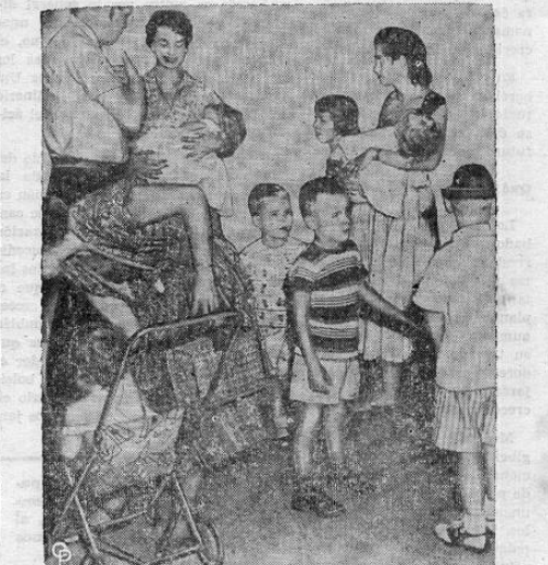
LOS PRIMEROS REFUGIADOS NORTEAMERICANOS de Iraq — en su mayoría mujeres y niños en el vestíbulo de un hotel en Roma, Italia, poco después de su llegada por avión desde Bagdad. Fueron los primeros de 1,500 norteamericanos que serán sacados por avión de Iraq desde que estalló la revolución.